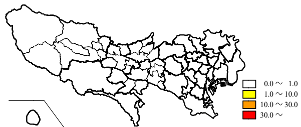
図2.保健所別定点当たり患者報告数(44週)

定点)、池袋(0.13人/定点)、江東区(0.07人/定点)、世田谷(0.04人/定点)の4保健所管内で患者報告がありました(図2)。